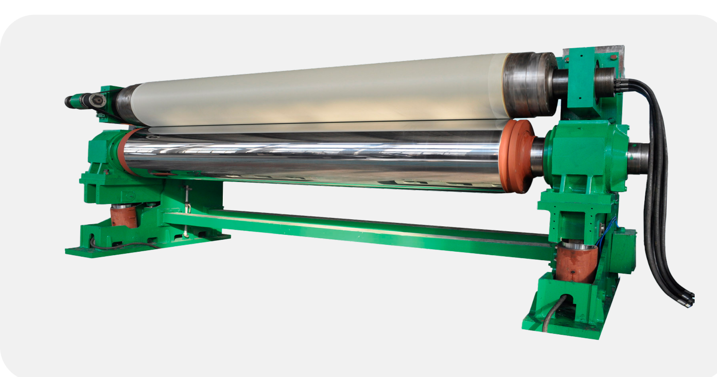
Каландр с мягким валом с регулируемым или постоянным прогибом