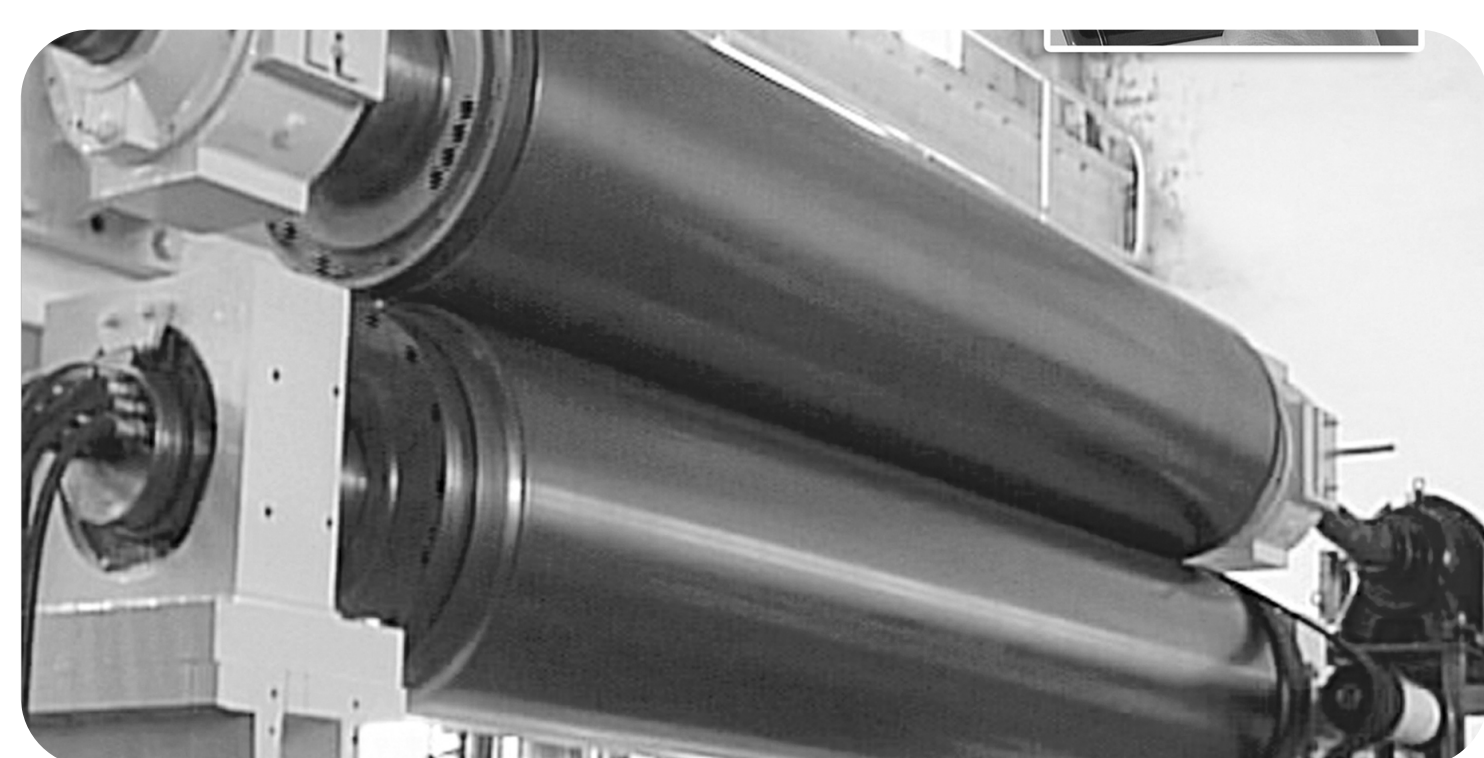
Каландр с жестким валом с регулируемым или постоянным прогибом