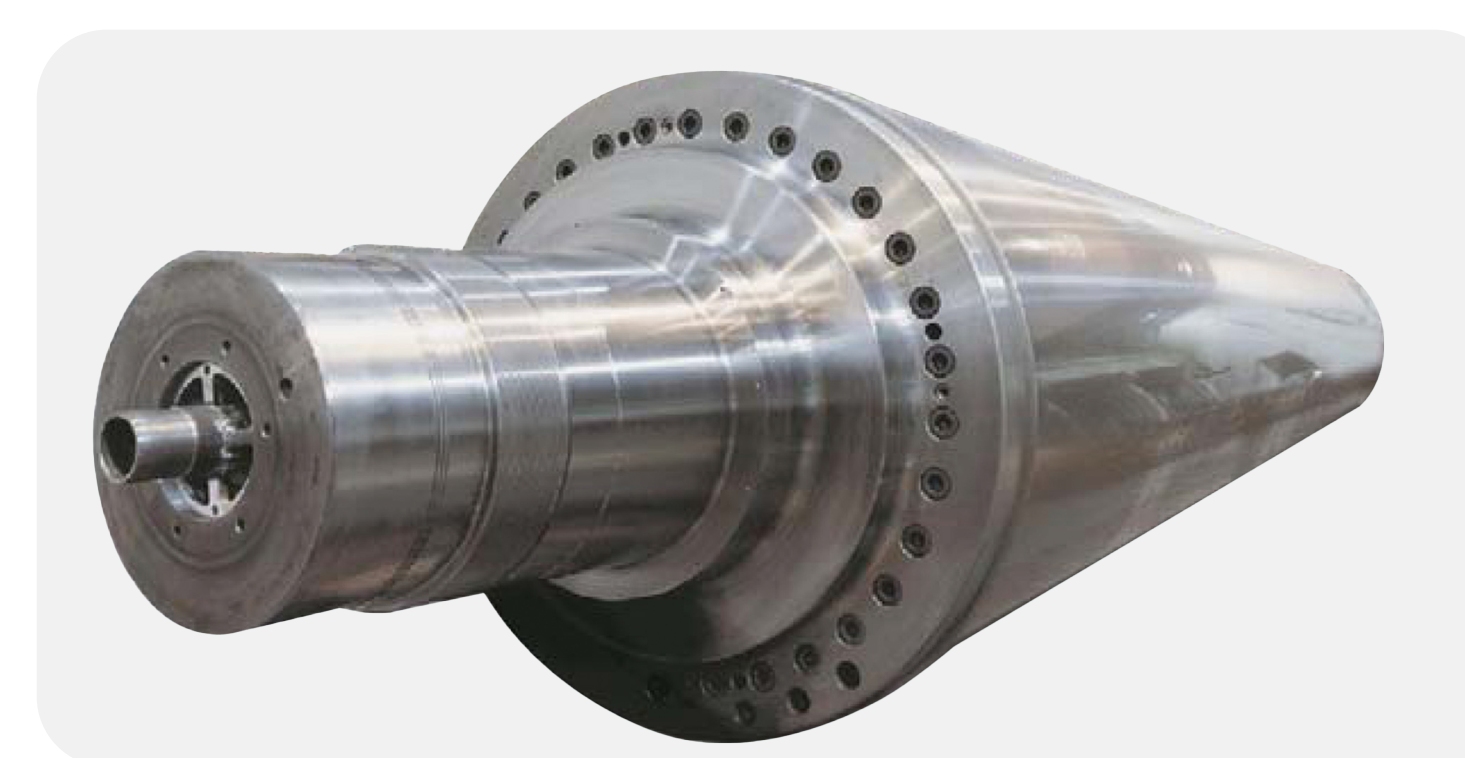
Каландровый вал для бумажной промышленности